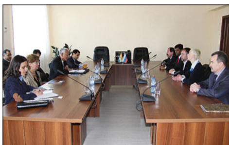
В конференц-зале нашей компании состоялась переговоры индийской делегации (слева) и руководства предприятия (справа)