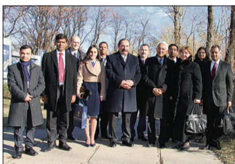
Господин Рагхаван посетил «Рудгормаш» с большой делегацией, в которую вошли представители посольства и индийского бизнес-сообщества