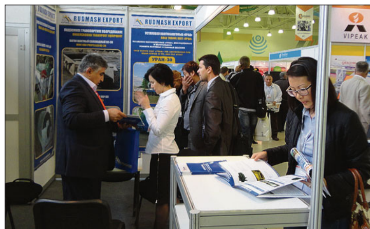
Стенд «Рудмашэкспорт» на выставке «Горное оборудование, добыча и обогащение руд и минералов – MiningWorld Uzbekistan-2014» в Ташкенте

В процессе работы экспозиции выяснилось, что многие горнодобывающие предприятия Узбекистана хотят работать с техникой нашего производства и в будущем планируют обновить свой парк машин буровыми станками «Рудгормаша». Основные причины такого доверия — это качество, прочность оборудования, высокий сервис обслуживания. Плюс ко всему рудгормашевские машины дешевле, чем аналогичное оборудование зарубежных компаний. Импортная техника дорого обходится при ремонтных работах и не всегда есть возможность приобрести для неё запасные части.