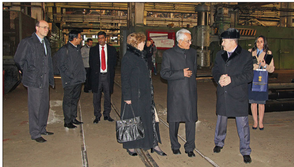
На предприятии его превосходительство Пунди Сринивасан Рагхаван познакомился с производством и посетил цех металлоконструкций № 7 и сборочный цех № 4