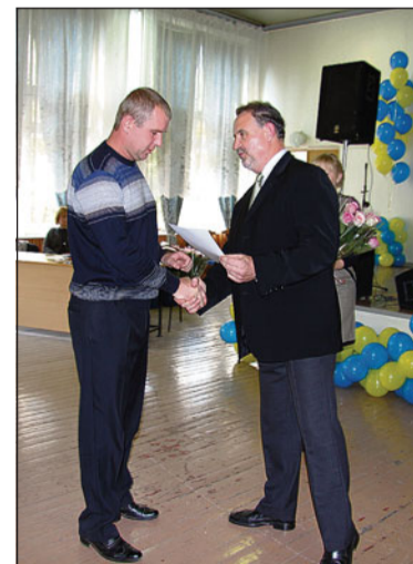
Руководство компании поздравило передовиков производства

Кроме того, всех гостей с юбилеем поздравил магазин конди-