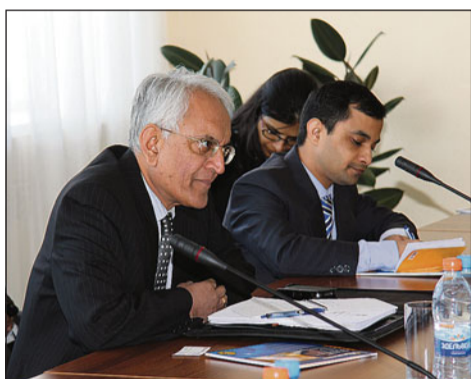
Посол Индии его превосходительство Пунди Сринивасан Рагхаван уверен, что Индия и «Рудгормаш» имеют перспективы сотрудничества